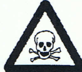
Warnung vor giftigen Stoffen