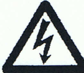
Warnung vor gefährlicher elektrischer Spannung