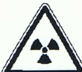
Warnung vor radioaktiven oder ionisierenden Stoffen