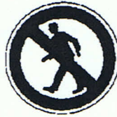
Für Fußgänger verboten