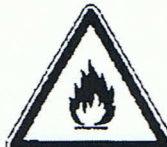
Warnung vor feuergefährlichen Stoffen