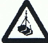
Warnung vor schwebender Last