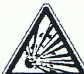
Warnung vor explosionsgefährlichen Stoffen