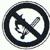
Feuer, offenes Licht und Rauchen verboten