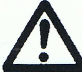
Warnung vor einer Gefahrenstelle