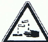
Warnung vor ätzenden Stoffen