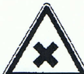
Warnung vor gesundheitsschädlichen oder reizenden Stoffen