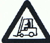
Warnung vor Flurförderzeugen