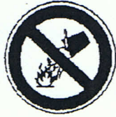
Mit Wasserlöschen verboten